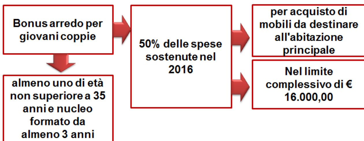
Fig. 1 – Condizioni bonus arredo per giovani coppie

I soggetti interessati, come accennato, sono le giovani coppie (coniugi o conviventi more uxorio ):